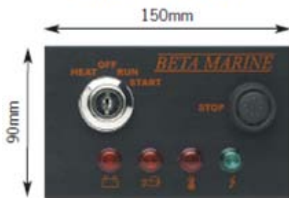
표준 콘트롤 패널 A