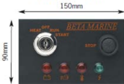
표준 콘트롤 패널 A